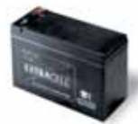
B12-B Аккумуляторная батарея для RO1124. 42,70 €